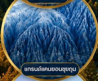
แกรนด์แคนยอนชยุถุน