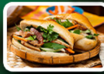
“บั้นเหมี”