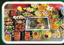
ปิ้งย่าง BBQ