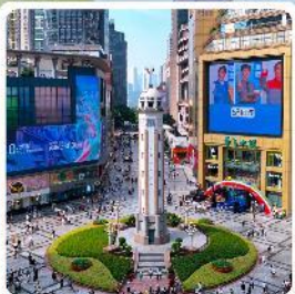
ถนนเจี๋ยฟางเป่ย์