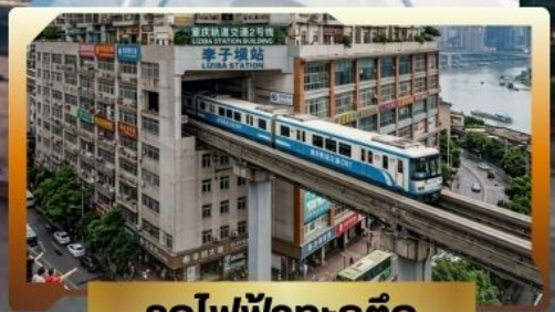
รถไฟฟ้ากะลุ่ก