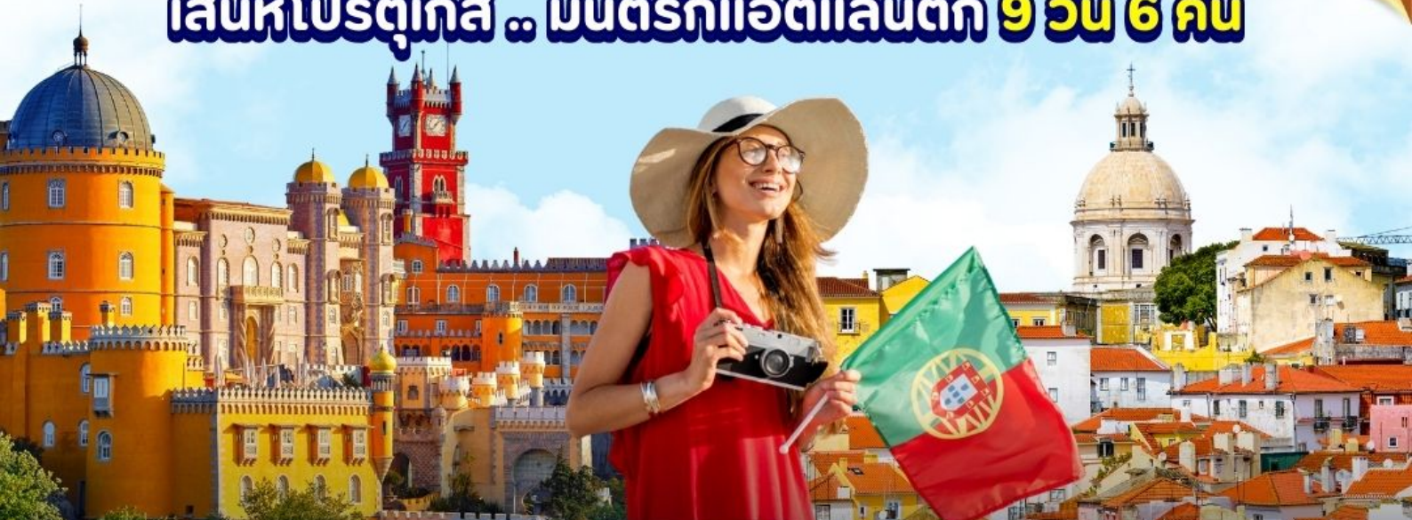
เที่ยวกรุงลิสบอน