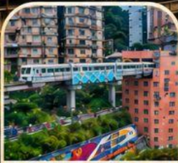
รถไฟทะลุติ๊ก สุดมหัศจรรย์