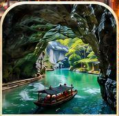
ล่องเรือผูสวา ธารน้ำใต้ดินลึกลับ