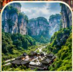
อุทยานเขานางฟ้า เสน่ห์แห่งธรรมชาติ