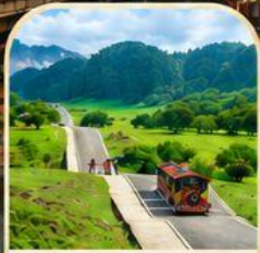
อุทยานหลุมฟ้า ธรรมชาติสุดยิ่งใหญ่