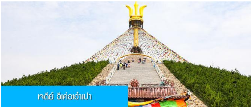
เจดีย์ อี้เค่อเอ๋่าเป่า

พักที่ DALAETQI SHNAGJING HOTEL โรงแรมระดับ 4 ดาวหรือเทียบเท่าในเมืองต้าลาเท่อ