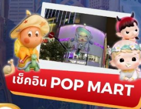
เบ็คอิน POP MART