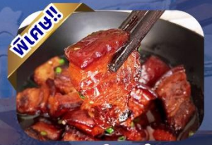
เมนูหมูสามชั้นตุ๋นน้ำแดง