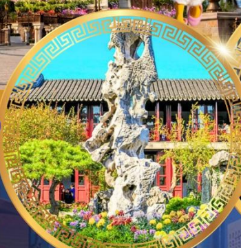
สวนหลิวหยวน

ถนนหนานจิงลู่ หาดไว่ทาน ชมหอไข่มุก ล่องเรือทะเลสาบซีหู ตำนานพญาชงชว เจดีย์เหลยเฟิง ถนนเสี่ยวเหอจื่อเจีย วัดหลงหยวน สวนหลิวหยวน ซ้อปบิ่ง ถนนกวนเจี้ยนเจีย ถนนซีหลี่ซานถั่ง วัดพระหยก เซกอินย่านเก่าซันเทียนตี้ สักการะศาลเจ้าพ่อหลีกเมือง