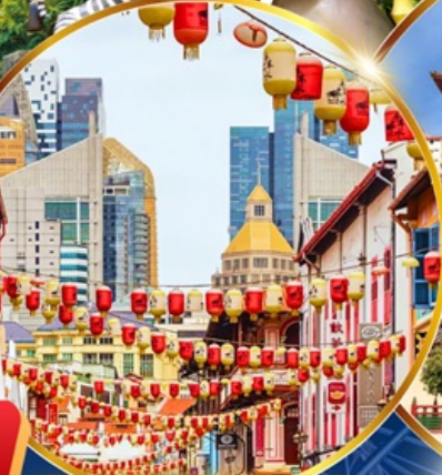
โซน่าทาวน์ สิงคโปร์