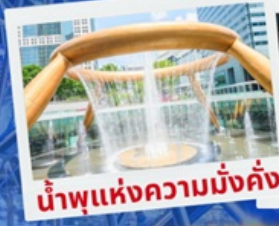
น้ำพุแห่งความมั่งคั่ง