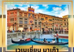
เวเนเซียน มาเก๊า