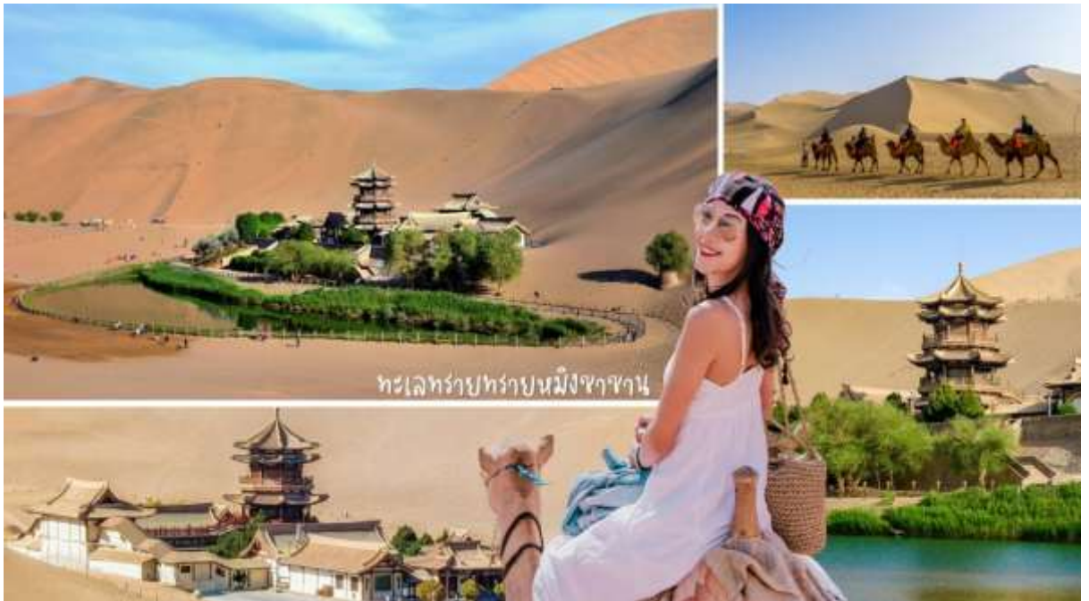
ทะเลทรายหยูหนิงซาซัน