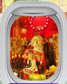
วัดเจ้าแม่กวนอิมสองฮา