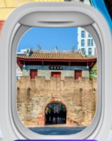
เมืองโบราณหนานโกว