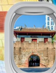
เมืองโบราณหนาวโกว