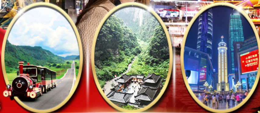
อุทยานเขานางฟ้า อุทยานหลุมฟ้า สะพานสวรรค์ ถนนคนเดินเจียฟางเป่ย์