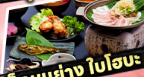
เช็กหมูย่าง ใบโอบะ

ราคาเริ่มต้น 29,919 บาท รวมภาษีมูลค่าเพิ่ม 7%