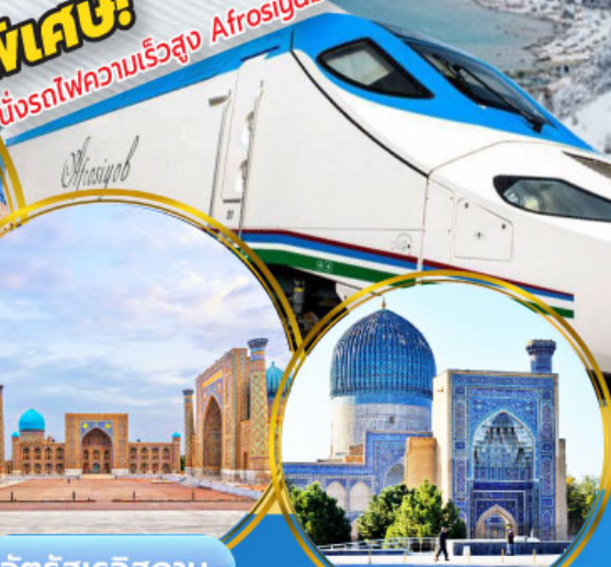
จัตุรัสเรจิสถาน