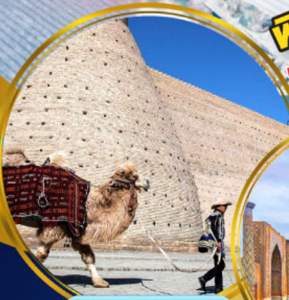
บ้อมปราสาทบุการ์่า