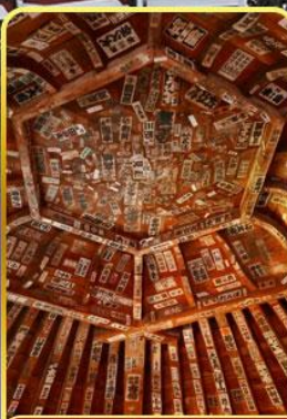
วัดซาชะเอโดะ