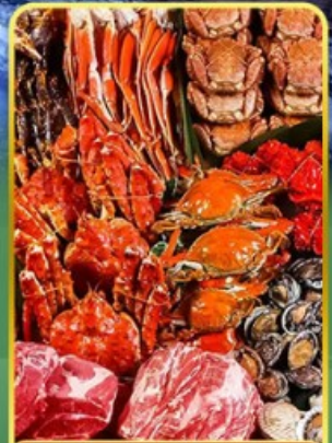
ปิ้งย่างพรีเมียมบนโต๊ะ