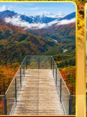
อาคุบะอิว่าดากะ