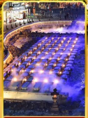
ชมยูซากาเกะ