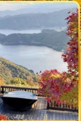
จุดชมวิวกะเลสาบมิกาดะ