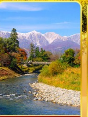
โออิเดะปาร์ค