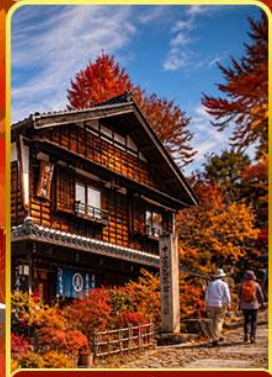
หมู่บ้านมาโกเมะจุกุ