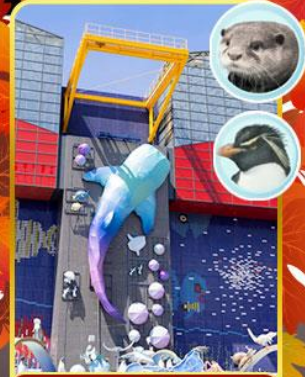
พิพิธภัณฑ์ไคยุคัง

ออนเซ็น 2 คั้น มน.กระเป๋า 23 กก.X2 8Days 5Night