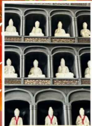
วัดโดชิซังเซโอดี