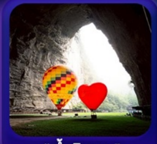
“ ถ้ำดึงหลง ”