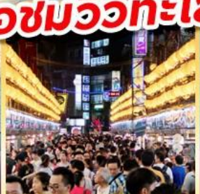
ไถจงไนท์มาร์เก็ต