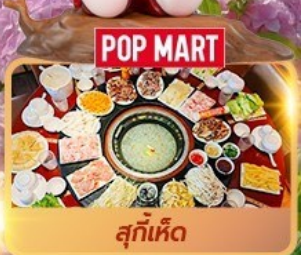
POP MART สุกี้เห็ด