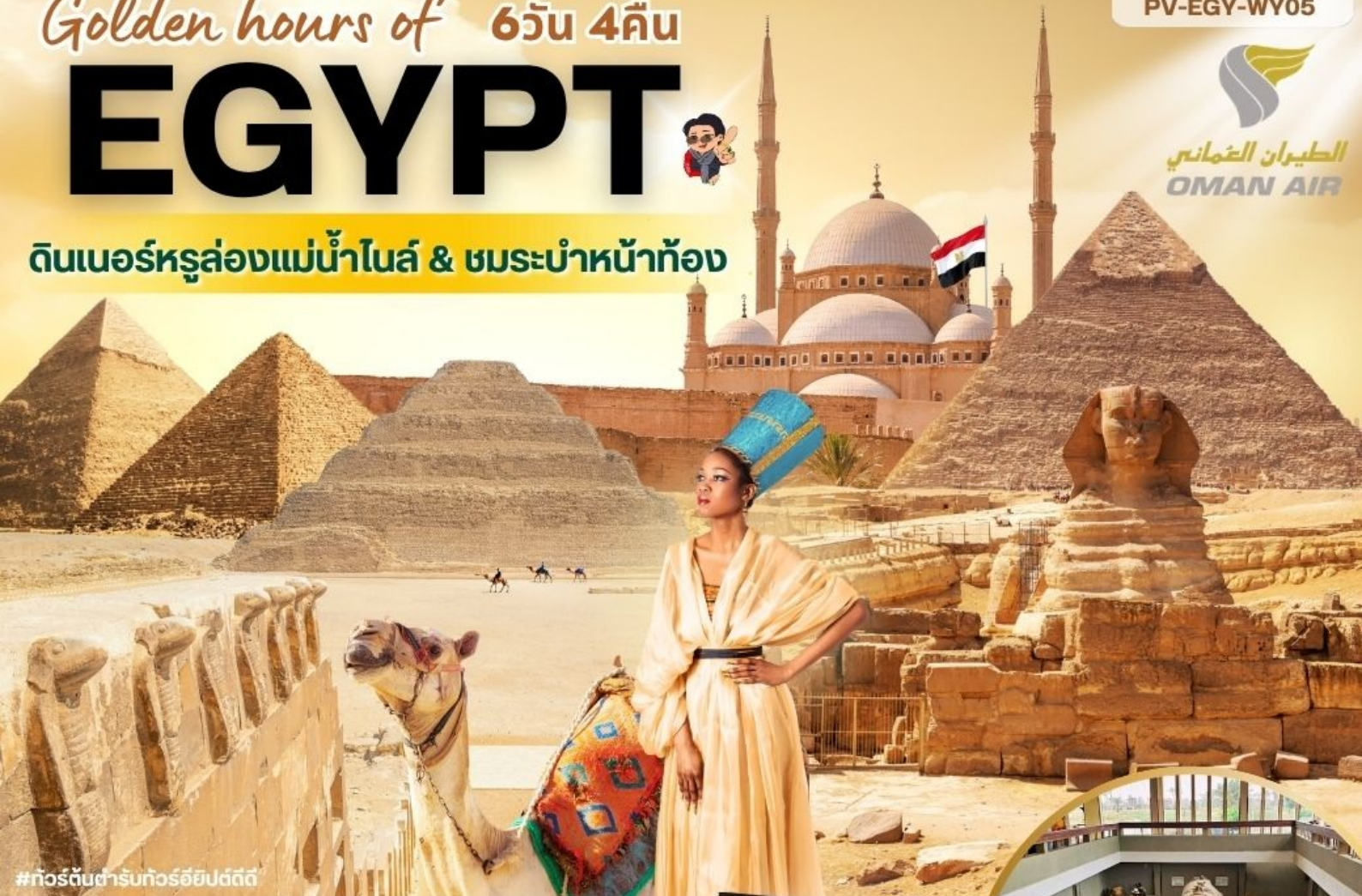
#ทัวร์ต้นตำรับทัวร์อียิปต์ดี

ดินเนอร์หล่องแม่น้ำไนล์ & ชมระบำหน้าห้อง