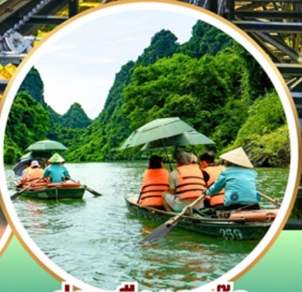
ล่องเรือตามกัก