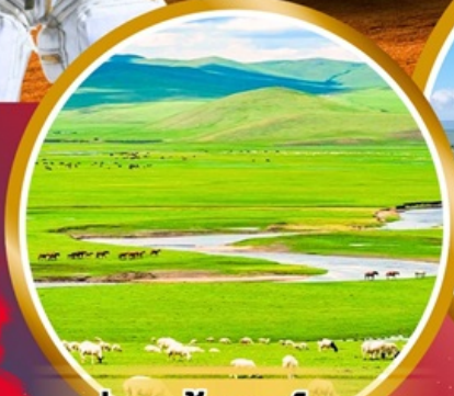
ทุ่งหญ้าออร์โดส

พิเศษ!!! สวมชุดของโกเลีย บนกระโหลกของโกเลีย