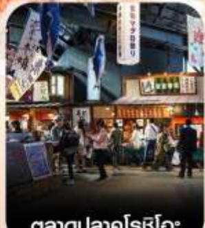
ตลาดปลาคุโรชิโอะ