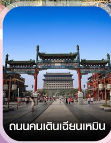
ถนนคนเดินเฉียนเหมิน

✈️ คอนเฟิร์มออกเดินทาง ทุกพีเรียด 2 ท่านขึ้นไป