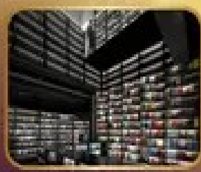
ชมร้านหนังสือ