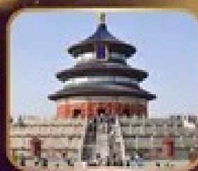
ชมความงดงาม