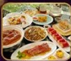
อาหารจีน 10 มื้อ