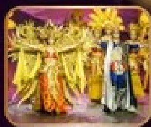
ชมชุดออกโชว์ระบำการตา