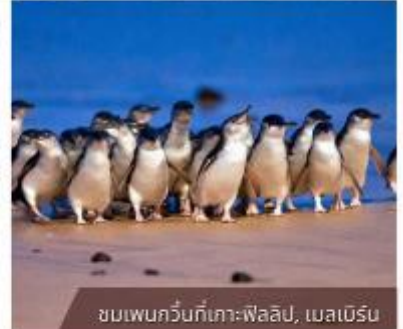
ชมเพนกวินที่เกาะฟาลิป, เมลเบิร์น