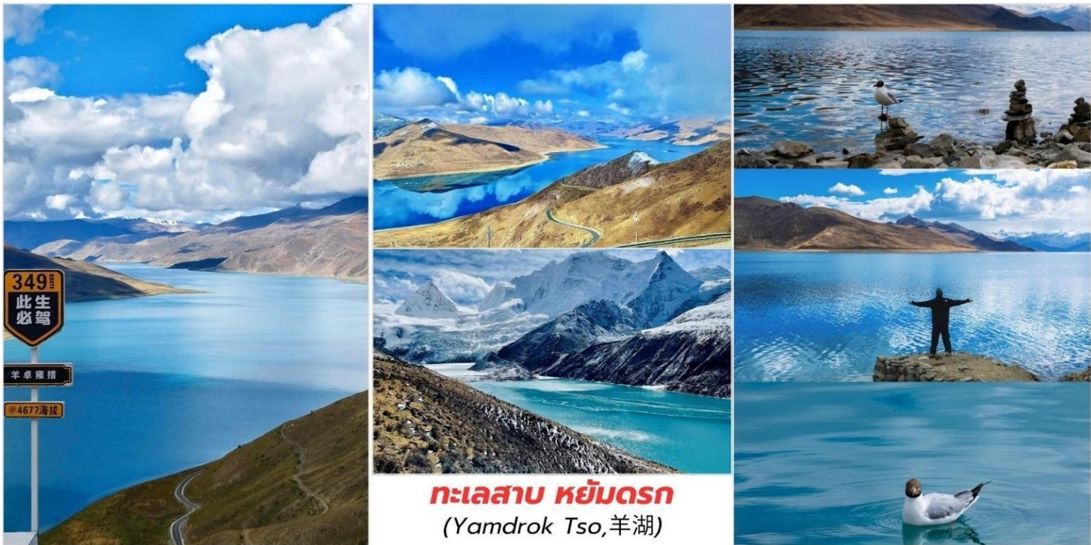
อย่างสวยงาม (ไม่รวมค่าบริการ)

จากนั้นนำท่านชม ทะเลสาบ หยัมดรอก (Yamdruk Tso, 羊湖) หรือที่ชาวทิเบตเรียกว่า หยัมดรอกยุมโซ เป็นหนึ่งในสามทะเลสาบศักดิ์สิทธิ์ ที่ยิ่งใหญ่ที่สุดของทิเบต (ร่วมกับทะเลสาบนามูโซและมานาชาโรวาร์) ความงดงามของทะเลสาบแห่งนี้คือสีฟ้าครามหรือ สีเทอร์ควอยซ์อันเป็นเอกลักษณ์ที่ตัดกับฉากหลังของภูเขาหิมะที่ปกคลุมตลอดปี ทำให้ที่นี่ได้รับสมญานามว่าเป็น "อัญมณีที่พระเจ้าประทานให้" บนหลังคาโลกเมื่อแสงแดดกระทบน้ำจะเปลี่ยนเฉด จากฟ้าแก่เป็นเขียวมรกต โดยมีพื้นหลังเป็นภูเขาหิมะหรือหิมะละลาย ทำให้รู้สึกถึงความสงบ และความยิ่งใหญ่ ของดินแดนหลังคาโลกแห่งนี้ อีสาระให้ท่านได้ถ่ายภาพทะเลสาบสีเทอร์ควอยซ์ด้านล่างตัดกับยอดเขา หิมะที่ปกคลุม ได้วิวกทะเลสาบบนที่สูงแบบ "เหนือเมฆ" หรือ ถ่ายภาพกับ จามรี (Yak) และ สุนัขทิเบตมาสตีฟฟ์ (Tibetan Mastiff) ที่ประดับประดา