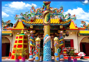
วัดพรศาลเจ้าท่ามังกะเย็บ