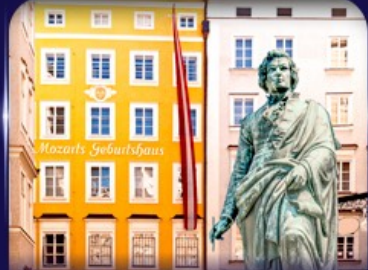
บ้านเกิดโมซาร์ท ซาลซบูร์ก