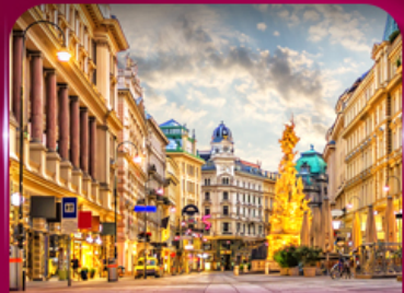
ชมเมืองโรมานติก เวียนนา