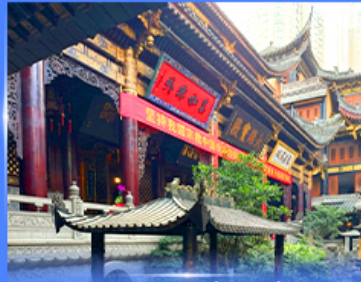
วอพรวัดหลวอจัน ฉงชิ่ง