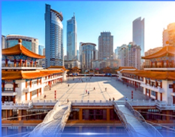
เซ็กคิน ตึกโควซิงโห