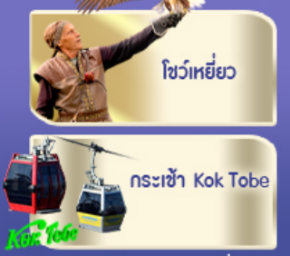
โซว์เหยี่ยว