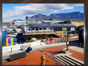
ท่าเรือ V&A waterfront