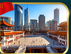
หมู่บ้านโบราณฉือซื่อ