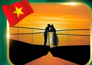
ชมอาทิตย์ตก ณ สะพานจูบ