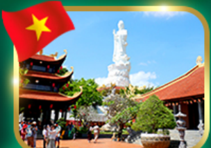
พระโพธิสัตว์กวนอิม วัดไถ่ก๊วก