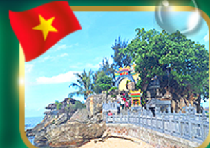
สักการะขอพรศาลเจ้ามังกร