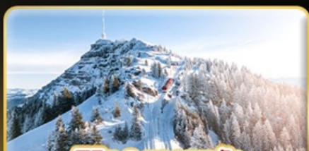
พีชิต 3 ยอดเขาดัง Rigi / Schilthorn / Gornergrat