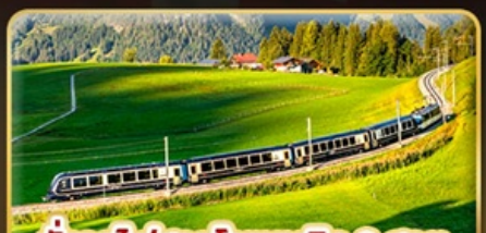
นั่งรถไฟสายโรแมนติก 3 สาย Golden Pass / Luzern Interlaken Express / Gornergrat