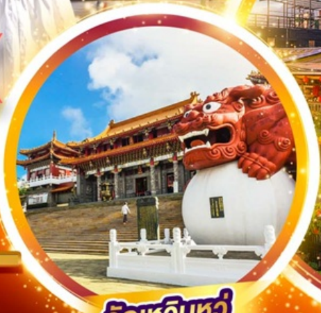
วัดหวินหฺวู่