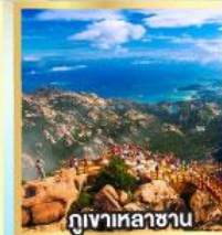
กุเอาหลาซาซาน