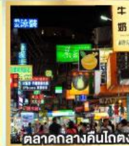
ตลาดกลางคืนโกตง