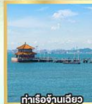
ท่าเรือจันเฉียว