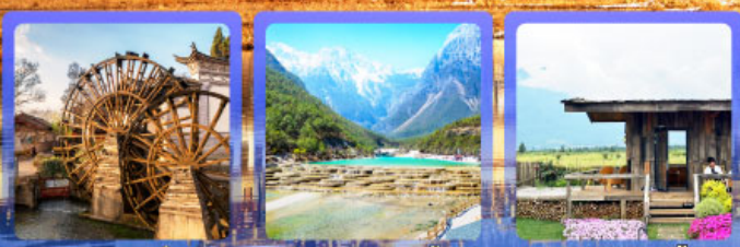
เมืองโบราณลี่เจียง หุบเขาพระจันทร์สีน้ำเงิน ร้านกาแฟหุบเขาคี๊อัน