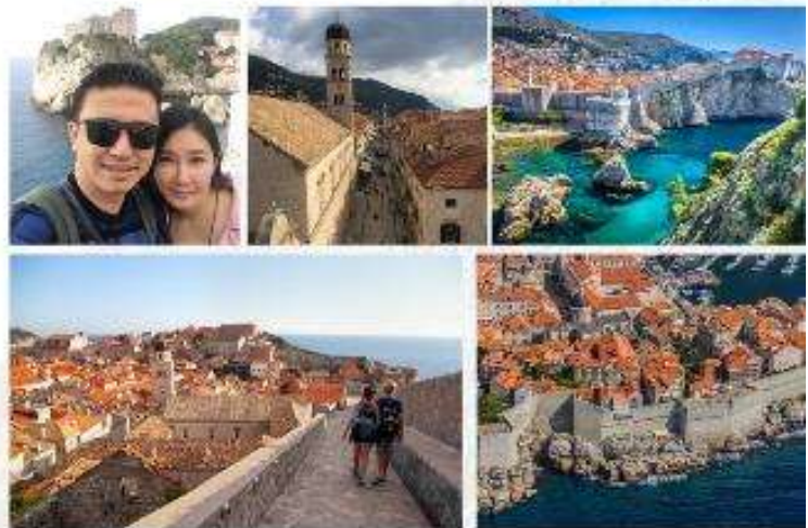
ห้ามพลาด!!! เชนบนกำแพงเมืองเก่าจากถ่ายทำ "Game of Throne" Must visit place in Dubrovnik