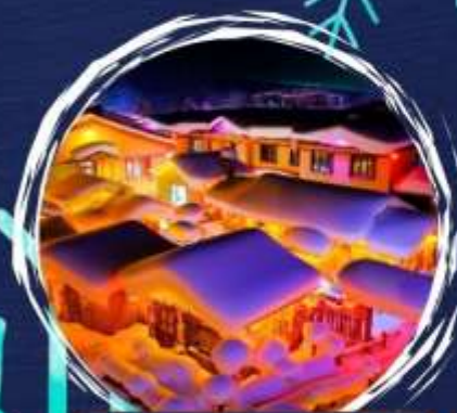
Dreamhome (กกลางคััน)