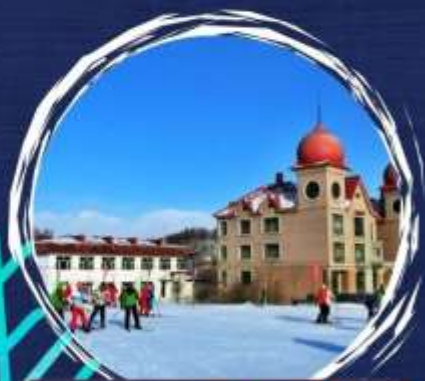
สานสกีขัาขุสั