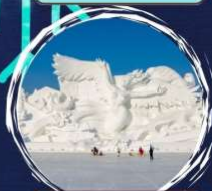
เกาะพระขัาขัคัขั