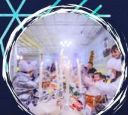
Suki Dome Ice