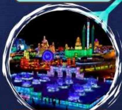
เขตสกาสนั้ขั้วขัั้ง