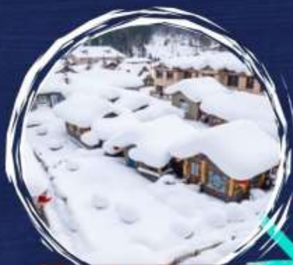
Dreamhome (กกลางขััน)