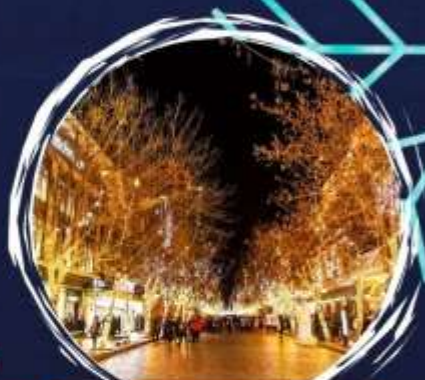
ถนนจขัขัขั