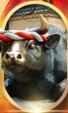
ศาลเจ้าคาซาฟู