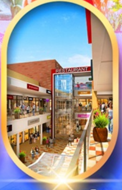
มิตซุชิอากะเกอิชิ