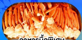
อาหารมือพิเศษ บุฟเฟ่ต์งาปู