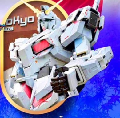
ห้างไอโดบะกันดั้ม