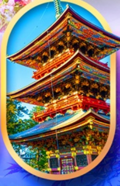
วัดนาริตะ-ซัน