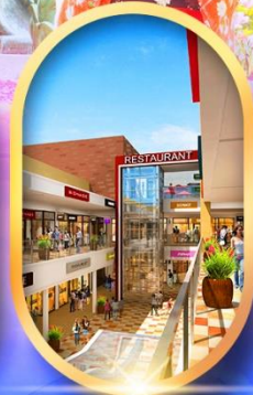
มิทซูเอากะเลียต