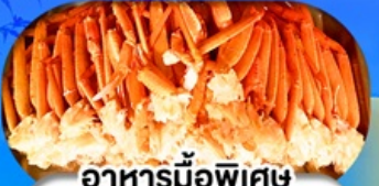
อาหารมือพิเศษ บุฟเฟ่ต์จาปู