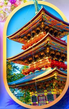
วัดนาริตะ-ซัน