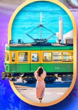
ถนนโคมาจิโดริ