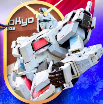
ห้างไอโดปะกับดัม