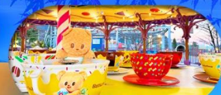
Fuji q Highland x Butterbear เดินทาง พ.ศ. 69 เป็นต้นไป