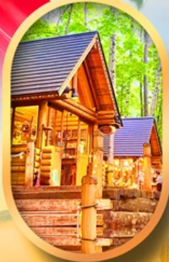
นิงเกิ้ลเกอเรส