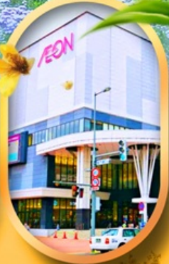
อีออนมอลล์