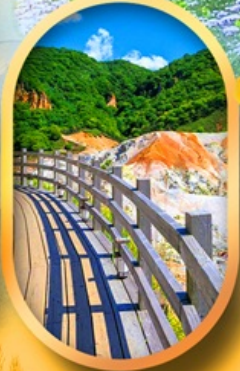
โนโบริเบทสึ