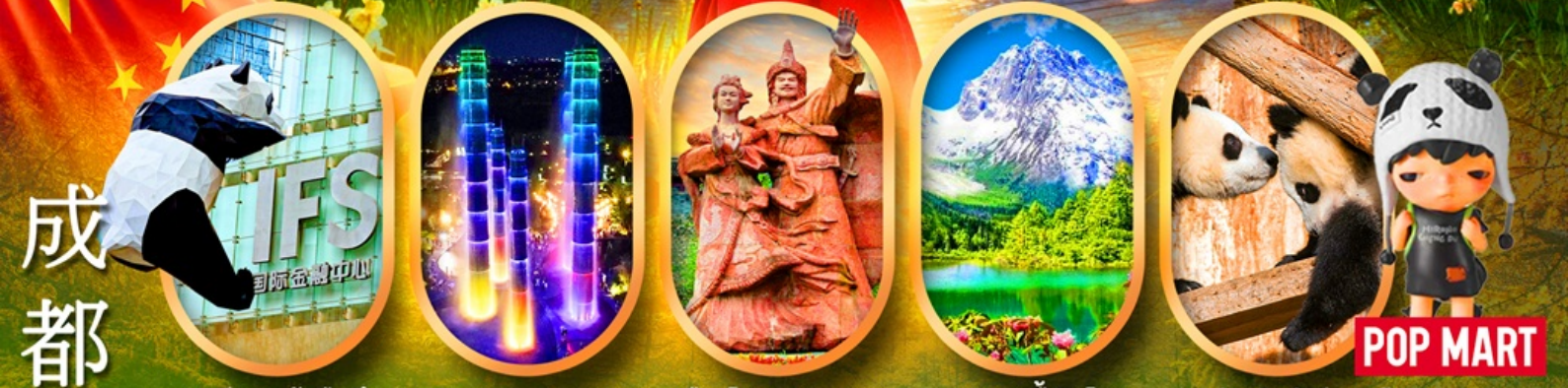
IFS หมีแพนด้าป็นตึก SKP Global Center เมืองโบราณชงพาน อุทยานปี้เฉิงโกว ศูนย์อนุรักษ์หมีแพนด้า

เจิงตู ปี้เฉิงโกว จิ้งจ้ายโกว หมีแพนด้าตัวเป็นๆ