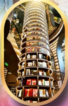
หอหนังสือจางชูก่อ