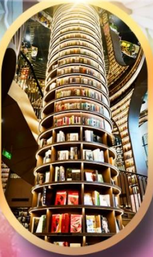
หอหนังสือจูกู๋เก๋อ