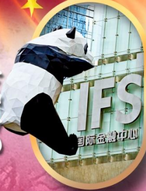
IFS หนีแพนด้าป็นตึก